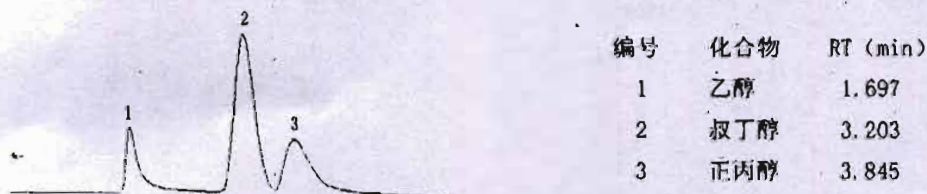
图A. 4 5%Carbowax-20M/Carbopack柱血中酒精含量检测色谱图 (柱4)