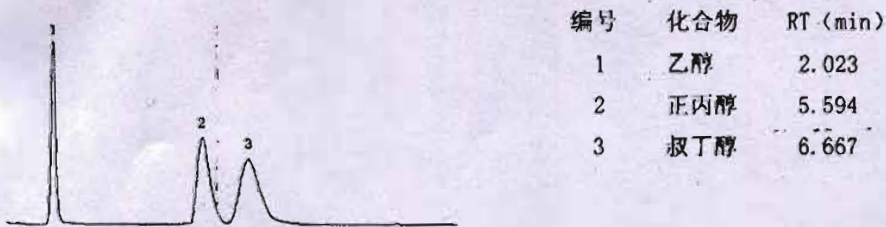
图A. 3 GDX-102柱血中酒精含量检测色谱图 (柱3)