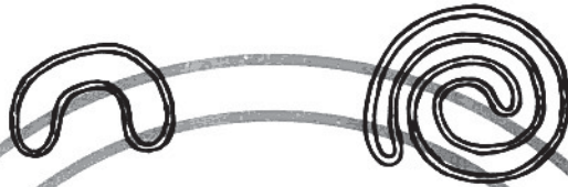
图 2 盘卷 O 形圈的参考方法