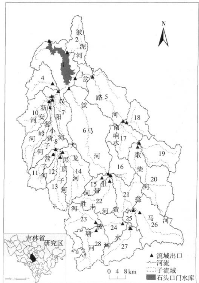
图1 石头口门水库及其上游流域子流域划分 Figure 1 Sub-catchments of Shitoukoumen Reservoir upper-river basin

水质数据通过野外实地水质监测获得。采样断面设置在各子流域出水口处,按照规范和标准方法 [11-12] ,